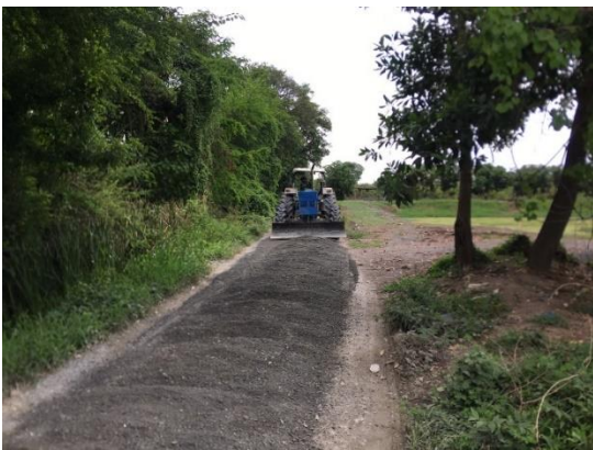
ระหว่างดำเนินการ