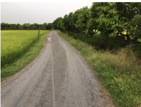
หลังดำเนินการ