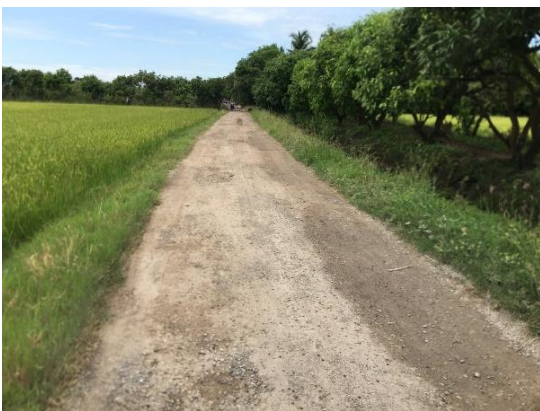
ก่อนดำเนินการ